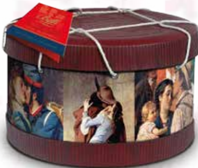
Cappelliera Baci e Amori