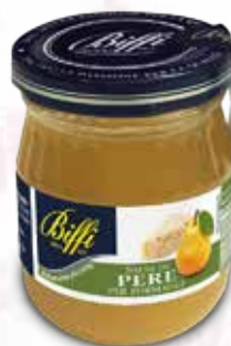
Salsa di Pere