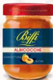
Confettura di Albicocche