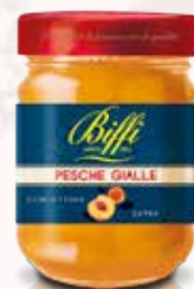
Confettura di Pesche Gialle