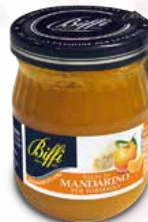
Salsa di Mandarino