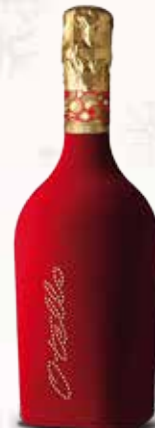
Vino Spumante Extra Dry - Ceci