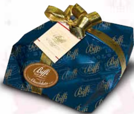
Gocce di Cioccolato Fondente