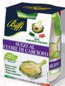
Sugo al Cuore di Carciofi

Senza Panna Senza Glutine Senza Conservanti 190 gr.