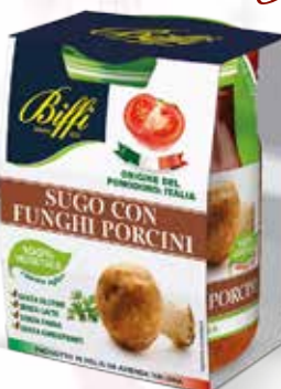
Sugo ai Funghi Porcini

Senza Carne Senza Glutine Senza Conservanti 190 gr.