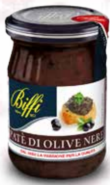
Patè di Olive Nere