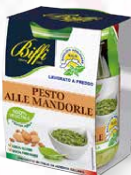
Pesto alle Mandorle