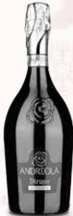
Vino Prosecco Andreola Dirupo