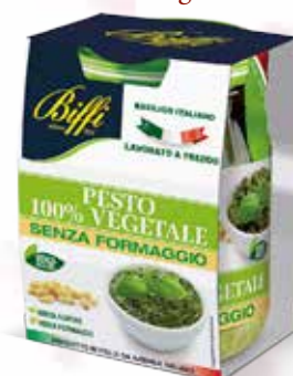
Pesto 100% Vegetale