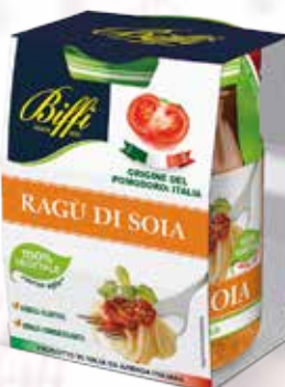
Ragù di Soia

Senza Carne Senza Glutine Senza Conservanti 190 gr.