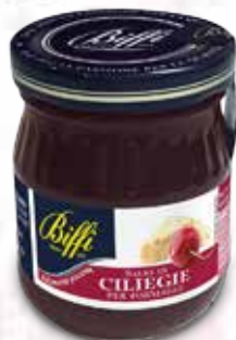
Salsa di Ciliegie