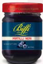
Confettura di Mirtilli Neri