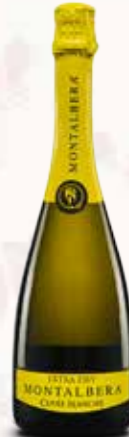
Vino Spumante Montalbera