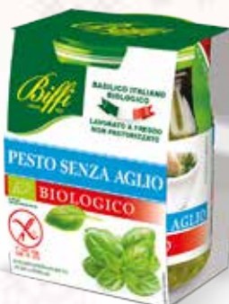
Pesto Biologico Senza Aglio