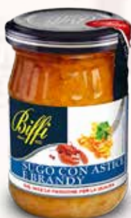
Sugo con astice e brandy