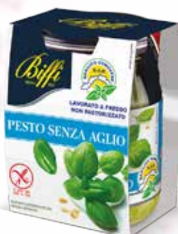
Pesto Senza Aglio