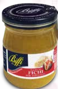
Salsa di Fichi