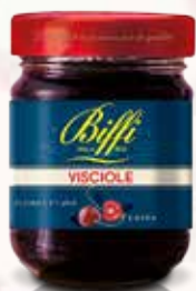
Confettura di Visciole