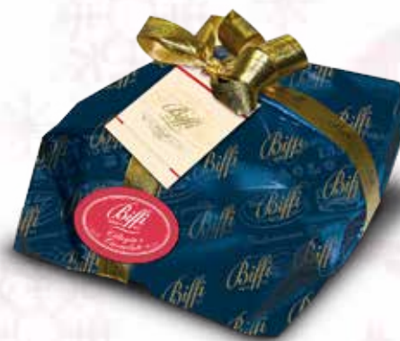
Ciliege & Cioccolato